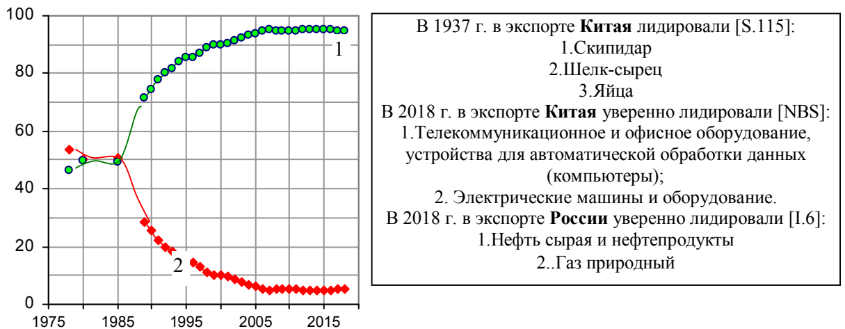
Рис. 1.570. Структура экспорта товаров из Китая (проценты): 1 – промышленные товары (manufactured goods); 2 – сырьевые товары (по данным National Bureau of Statistics of China).

Резко, кардинально и в лучшую сторону в период китайских реформ изменилась общая структура экспорта Китая (рис. 1.570 – 1.572). В настоящее время она соответствует структуре экспорта высокоразвитых стран.