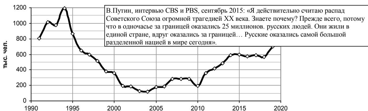
Рис. 2.13. Количество человек, прибывших в РФ (в основном из стран СНГ и Балтии).

Беженцы с «окраин» за бесценок отдавали свои квартиры, имущество и, вопреки препятствиям, создаваемым чиновниками, возвращались в Россию. Оседали, в основном, в небольших городах, поселках, деревнях, в которых недорогое жилье. Работы в небольших городах нет, в деревнях зарплата мизерная и «мигранты» были поставлены на грань выживания, еще более острую, чем коренные жители глубинки. Но именно они несколько улучшили демографическую ситуацию в России. Именно приездом на родину миллионов русских, бежавших из стран СНГ, частично компенсировались потери населения. Именно благодаря их приезду не так резко уменьшалась численность населения России в период реформ (рис. 2.13), не так заметны были провалы в демографической политике.