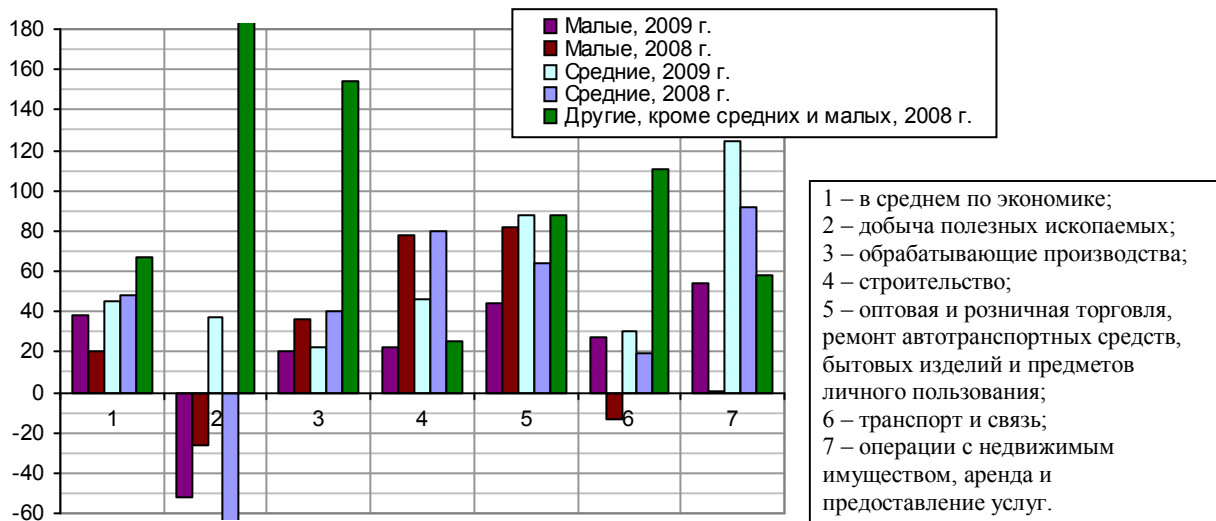
Рис. 1.407, б. Сальдированный финансовый результат (прибыль минус убыток) деятельности малых, средних и других предприятий, полученный в среднем на одного работника за год, тыс. руб.

Оценить, насколько велики поступления в бюджет государства от деятельности 2,66 млн. малых предприятий пока не представляется возможным.