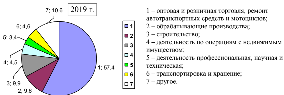
Рис. 1.405. Оборот малых предприятий России по некоторым видам экономической деятельности в процентах от общей величины оборота этих предприятий.

Во-первых , обратим внимание на структуру сферы деятельности малых предприятий (рис. 1.405). Наибольшее их количество занято торговлей, в том числе - недвижимостью.