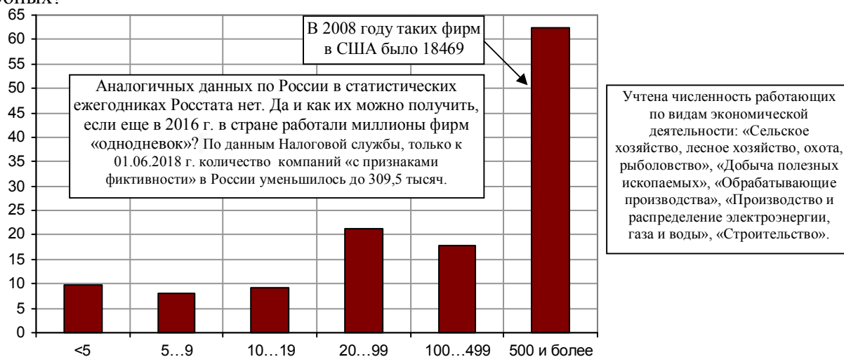
Рис. 1.408. Численность работников (включая управленческий персонал) на крупных, средних и малых предприятиях в промышленности, строительстве и в сельском хозяйстве США в 2008 году. По горизонтальной оси – количество работающих на одном предприятии (человек), по вертикальной – общее количество работающих на всех предприятиях этой группы (млн. человек). Источник: UNCTADstat.

Основная же роль в развитии экономики страны принадлежит средним и крупным предприятиям, которые могут внедрять высокоэффективные технологии, применять современные технологические режимы и оборудование, внедрять изобретения, привлекать высококвалифицированных специалистов, проводить научные и практические исследования и т.д. Наибольшее количество работающих в высокоразвитых странах – не на малых и мелких предприятиях, а на крупных (рис. 1.408). Именно они – двигатели прогресса в развитых странах, у всех на слуху их названия. Какие наши крупные передовые компании (кроме сырьевых, типа Газпрома, доставшихся нам от Советской России) мы можем поставить в один ряд с Siemens, Panasonic, Samsung, Nokia, Sony, Intel, Microsoft и с тысячами подобных?