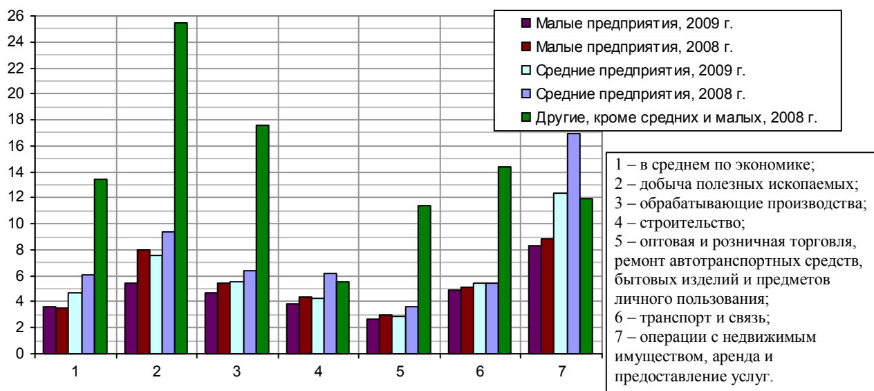
Рис. 1.407, а. Рентабельность проданных товаров, продукции (работ, услуг) предприятий по видам экономической деятельности в 2008 г., проценты.

В-третьих , эффективность работы малых предприятий ниже, чем средних и крупных (если судить по бухгалтерской отчетности). Оценим ее по двум показателям – по рентабельности проданных товаров и по величине сальдированного финансового результата (прибыль минус убыток) на одного работника по видам экономической деятельности (рис. 1.407). Понятно, что многие предприятия разными способами стремятся уменьшить в отчетности величину прибыли для уменьшения суммы налоговых платежей.