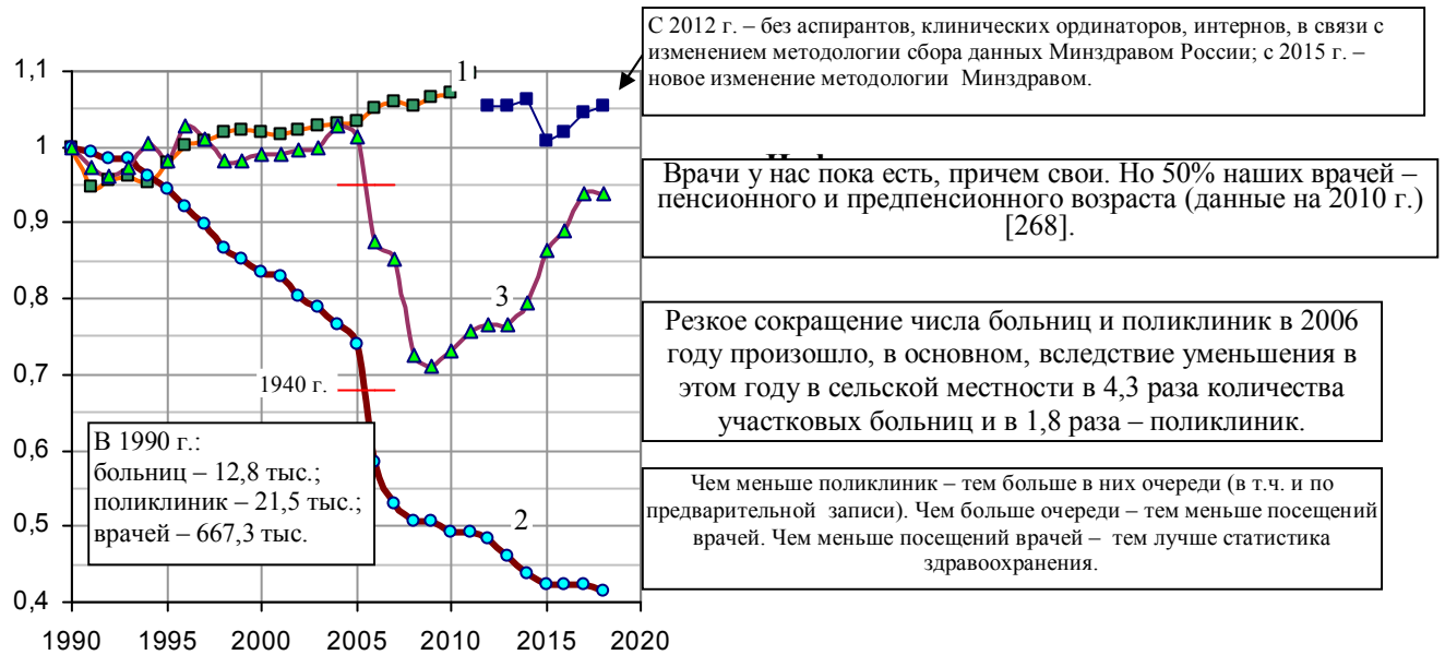
Рис. 3.4, а. Изменение количества врачей (1), больничных учреждений (2), врачебных амбулаторно-поликлинических учреждений (3); 1990 г. – 1, по данным на конец года.

Рост заболеваемости населения сопровождался уменьшением числа больниц и больничных коек в медучреждениях, но увеличением числа врачей (рис. 3.4, 3.5). Первое объясняется недостаточным финансированием здравоохранения, второе – сложностью изменения профессии для врачей; мало кто из них переквалифицировался во время реформ в челноков, продавцов, менеджеров, риэлторов.