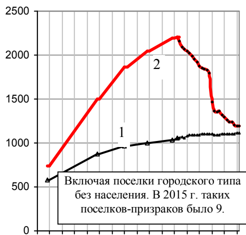
Рис. 2.17. Количество городов (1) и поселков городского типа (2) на начало года. Источники: [I.6].

За 1989 – 2010 гг. в России количество городов увеличилось на 62, но на 898 сократилось количество поселков городского типа (рис. 2.17).