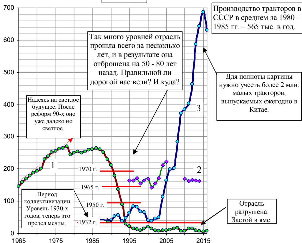
Рис. 1.150. Производство тракторов на колесном и гусеничном ходу в России (1), в Японии (wheel tractors + crawler tractors, линия 2), крупных и средних тракторов в Китае (3), тыс. штук. Источники: National Bureau of Statistics of China; Statistics Bureau, Japan; [I.3, I.4, I.6].