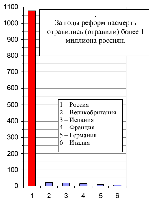
Рис. 2.48, б. Суммарное количество погибших от случайных отравлений за период 1992 – 2010 гг., тысяч.