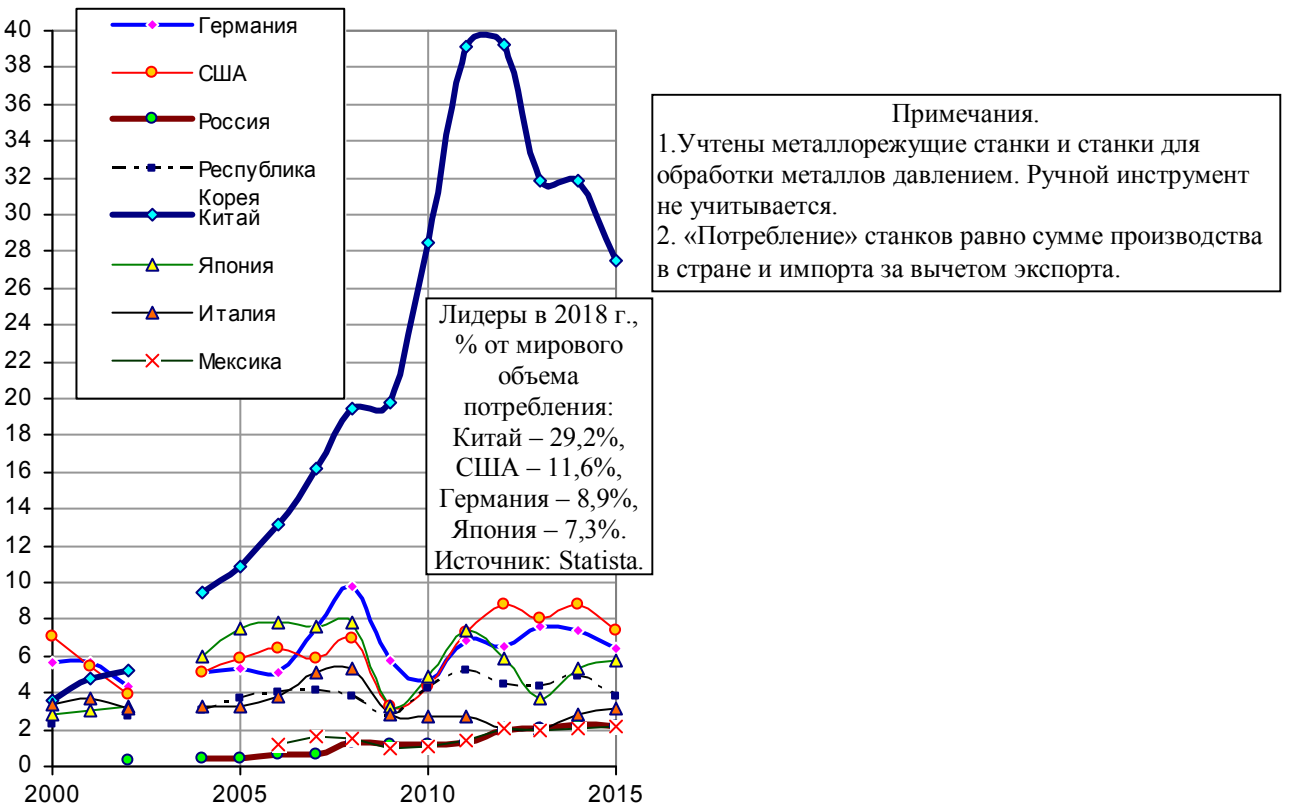
Рис. 1.156, в. Поставка станков в промышленность стран – лидеров по этому показателю («потребление» станков), млрд. долл. Источники: [458, S.106].