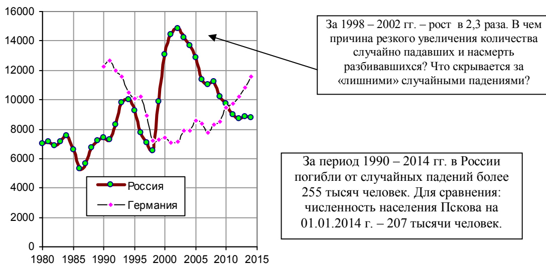
Рис. 2.46. Количество погибших при случайных падениях.

Из книги «Российские реформы в цифрах и фактах», http://refru.ru