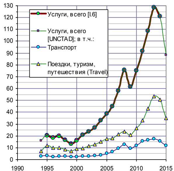
Рис. 1.609, в. Объем импорта услуг РФ, млрд. долл., текущие цены.

Дополнительную информацию и список источников см. в книге или на сайте.