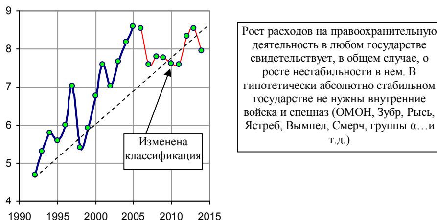
Рис. 1.480, а. Доля расходов на правоохранительную деятельность и обеспечение национальной безопасности государства в общей сумме расходов консолидированного бюджета РФ, %. Примечание: с 2005 года изменена бюджетная классификация. Источник: [1.6].