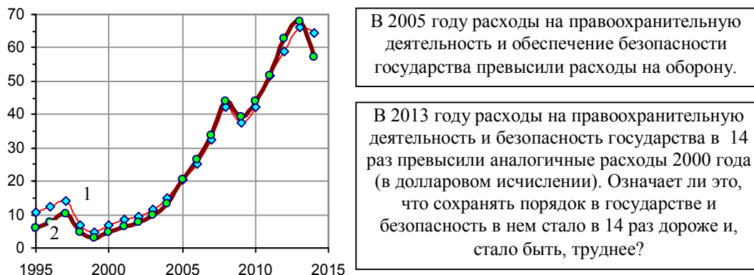
Рис. 1.479. Расходы консолидированного бюджета РФ на оборону (1) и правоохранительную деятельность и обеспечение безопасности государства (2), млрд. долл. Источники: [1.6, 1.7]. Данные в рублях пересчитаны в доллары США по среднегодовым курсам.

Рост расходов на правоохранительную деятельность и обеспечение безопасности государства связан, во-первых, с ростом преступности, в т.ч. обусловленной распространением наркотиков, расслоением общества по величине доходов и ростом напряженности в нем. Во вторых - с террористическими угрозами и угрозами национальной безопасности. Растет и уровень жизни работников правоохранительных органов.