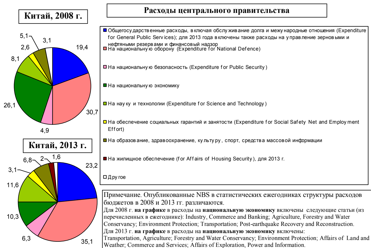
Рис. 1.485, а. Структура расходов бюджета центрального правительства Китая, проценты.