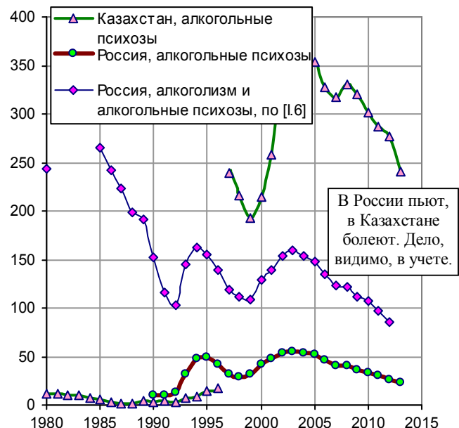
Рис. 3.107. Заболеваемость алкогольными психозами в России и Казахстане, на 100 тыс. чел. населения; заболеваемость алкоголизмом и алкогольными психозами в России, на 100 тыс. чел. населения.