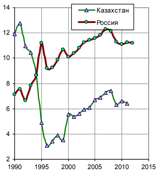
Рис. 3.106. Регистрируемое потребление алкоголя (в пересчете на спирт) на душу населения в возрасте 15 лет и старше в России и Казахстане, л/чел.

Что касается оценки количественных показателей заболеваемости алкогольными психозами, то это занятие пока неблагоприятное, поскольку эти показатели, видимо, зависят не столько от самой заболеваемости, сколько от правильности регистрации и диагностики психозов. Одно из подтверждений этих слов - на рис. 3.106, 3.107.