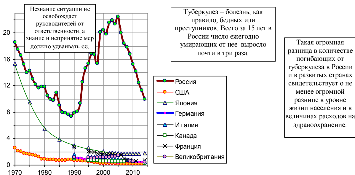
Рис. 3.16. Смертность от всех форм туберкулеза в России и в странах «семерки», количество умерших за год на 100 тыс. жителей. Источники: [1.6, 1.24, 1.29]; UN Demographic Yearbook; U.S. Census Bureau; National Vital Statistics Report; Japan Statistical Yearbook; The Federal Health Monitoring System, Germany; ООН, Департамент по экономике и социальным вопросам, официальный сайт ООН «Показатели достижения целей в области развития, сформулированных в Декларации тысячелетия», unstats.

Из книги «Российские реформы в цифрах и фактах», http://refru.ru