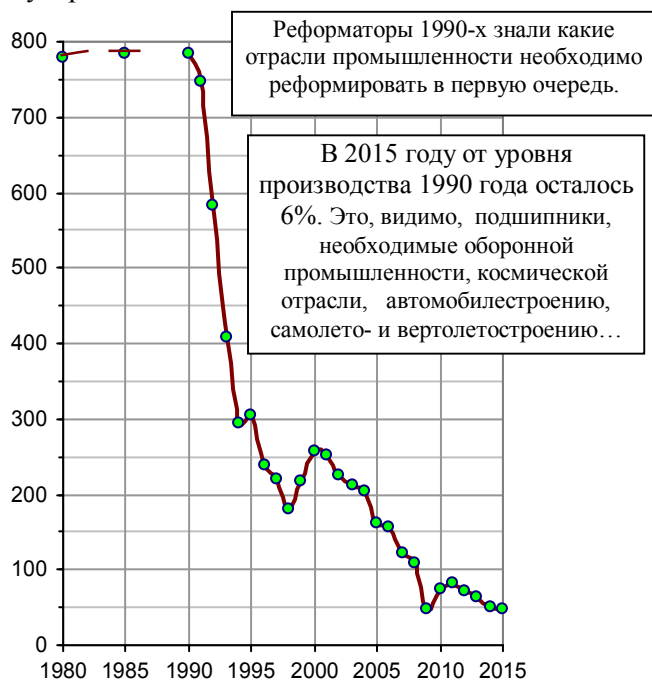
Рис. 1.158, а. Производство подшипников качения в РСФСР и в РФ, млн. шт.

Подшипники производятся для машин, станков и приборов. Поэтому изменение объемов их производства - один из важных косвенных показателей развития (деградации) машиностроения в государстве.