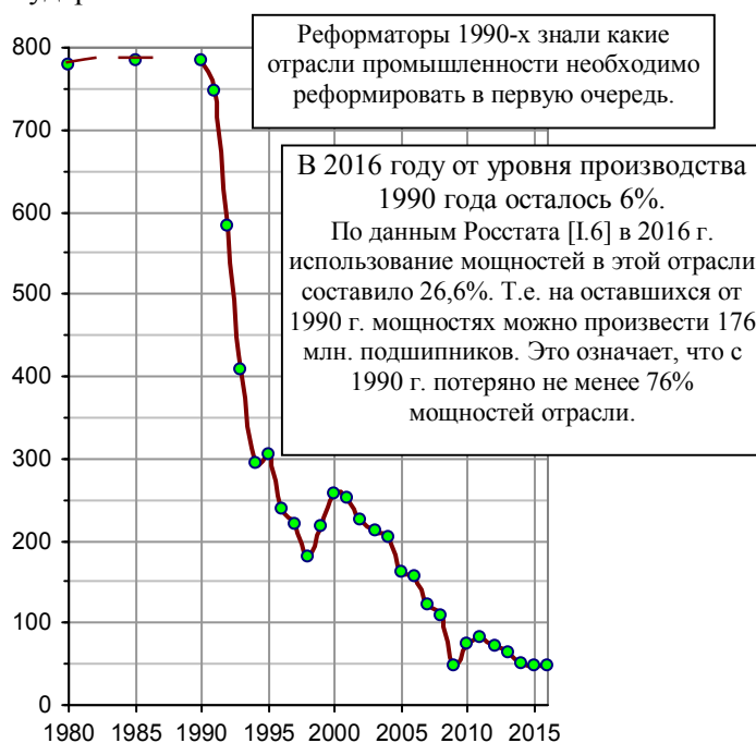
Рис. 1.158, а. Производство подшипников качения в РСФСР и в РФ, млн. шт.

Подшипники производятся для машин, станков и приборов. Поэтому изменение объемов их производства - один из важных косвенных показателей развития (деградации) машиностроения в государстве.