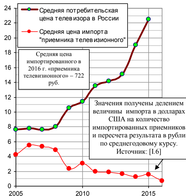
Рис. 1.188, в. Средняя потребительская цена телевизора в России на конец года и средняя цена импортированного «приемника телевизионного», тыс. руб.

2. Приводя данные о производстве телевизоров (и некоторой другой сложной бытовой техники) в России, необходимо отметить также следующее. В советские времена телевизоры в стране производились . В настоящее время большинство (причем подавляющее) телевизоров собираются из иностранных комплектующих, т.е. это не отечественные телевизоры. Уже к концу нулевых доля таких приблизилась к 90% от общего объема выпуска.