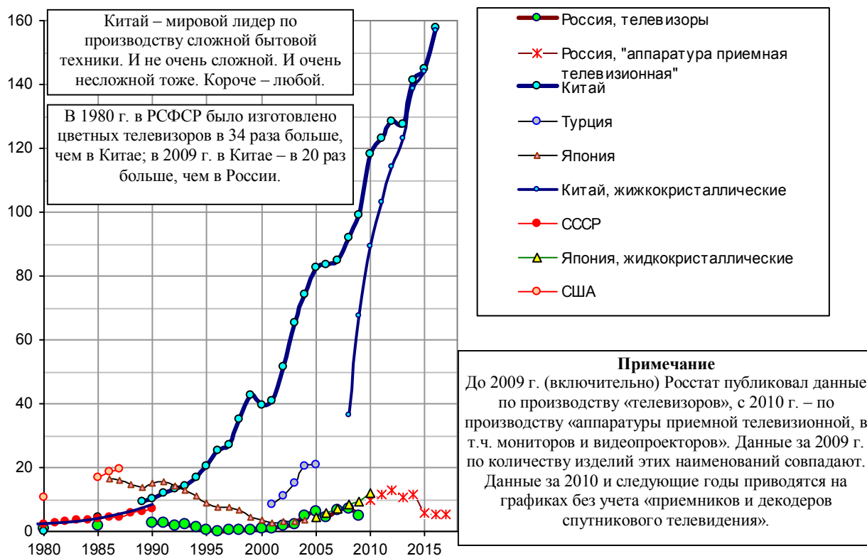
Рис. 1.188, а. Производство цветных телевизоров (включая жидкокристаллические), млн. штук. Для России с 2010 г. – производство «аппаратуры приемной телевизионной, в т.ч. мониторов и видеопроекторов», без «приемников и декодеров спутникового телевидения».

Значительный рост объемов производства телевизоров в России по данным Росстата не сопровождался громом фанфар, репортажами с построенных заводов. Почему?