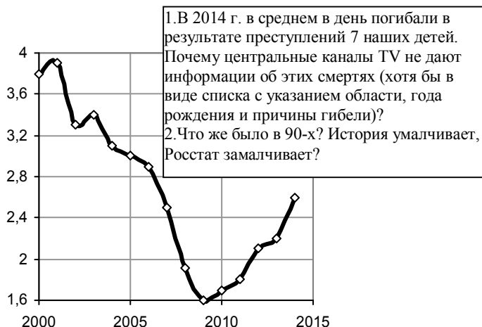
Рис. 2.135. Количество несовершеннолетних (до 17 лет включительно), погибших в результате преступлений, тысяч человек.