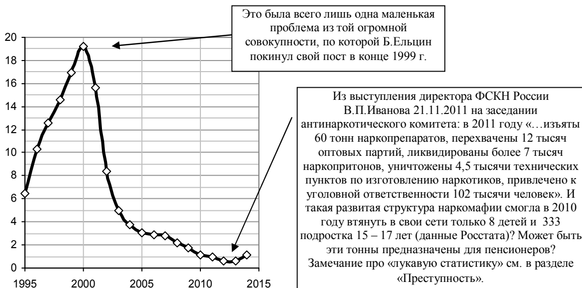
Рис. 2.117. Изменение количества больных наркоманией подростков в возрасте 15 – 17 лет, состоящих на учете в лечебно-профилактических учреждениях (1990 год - 1). Источник: [I.6].

Список литературы и дополнительную информацию см. на сайте или в книге