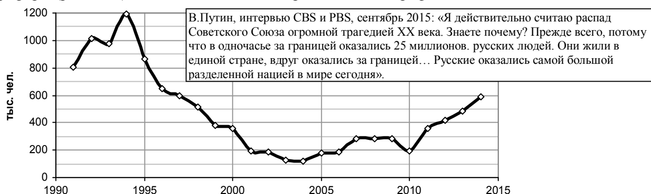
Рис. 2.13. Количество человек, прибывших в РФ (в основном из стран СНГ и Балтии).

Беженцы с «окраин» за бесценок отдавали свои квартиры, имущество и, вопреки препятствиям, создаваемым чиновниками, возвращались в Россию. Оседали, в основном, в небольших городах, поселках, деревнях, в которых недорогое жилье. Работы в небольших городах нет, в деревнях зарплата мизерная и «мигранты» были поставлены на грань выживания, еще более острую, чем коренные жители глубинки. Но именно они несколько улучшили демографическую ситуацию в России. Именно приездом на родину миллионов русских, бежавших из стран СНГ, частично компенсировались потери населения. Именно благодаря их приезду не так резко уменьшалась численность населения России в период реформ (рис. 2.13), не так заметны были провалы в демографической политике.