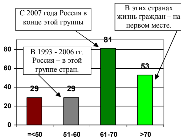
Рис. 2.162, а. Распределение 192 стран мира по средней ожидаемой продолжительности жизни мужчин при рождении (по горизонтали – диапазон лет СОПЖ, лет, по вертикали – число стран). Источник: WHO, World Health Statistics, 2006.

Дополнительную информацию см. в книге «Российские реформы в цифрах и фактах», http://refru.ru