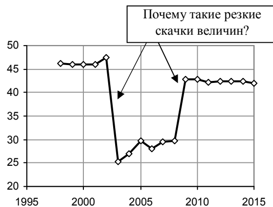
Рис. 3.9. Доля (%) больных туберкулезом органов дыхания, имевших запущенную его форму. Источник: [1.6].

Список литературы и дополнительную информацию см. в книге или на сайте.