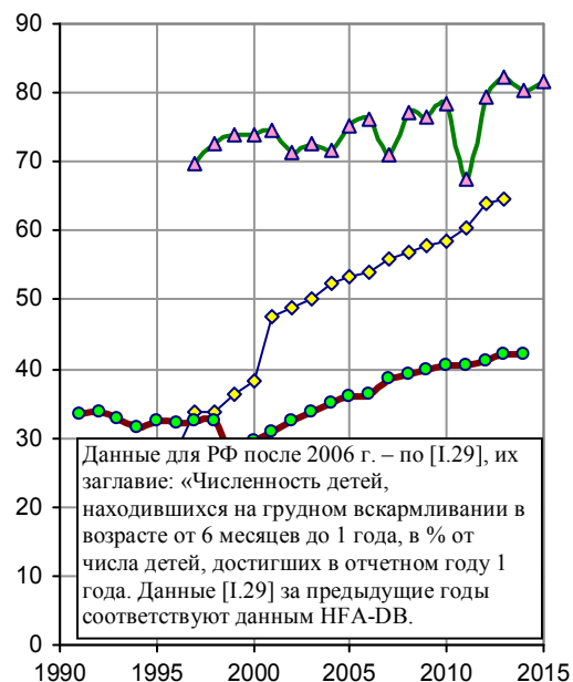
Рис. 3.42, б. Процент детей 6-месячного возраста, вскармливаемых грудью. Источники: European health for all database (HFA-DB), WHO/Europe; [I.29].

Список литературы см. в книге или на сайте.