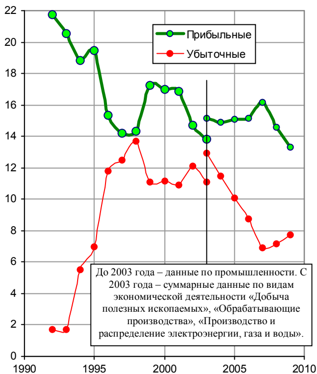
Рис. 1.70, б. Количество прибыльных и убыточных организаций в промышленности, тысяч. В связи с изменением классификации данные приведены для двух периодов.