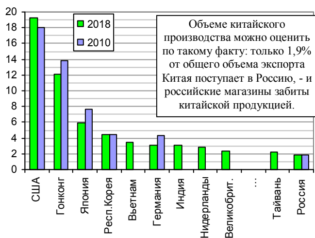
Рис. 1.590, а. Основные страны - импортеры китайской продукции и их доля (%) в общем объеме экспорта Китая.

Из книги «Российские реформы в цифрах и фактах», http://refru.ru