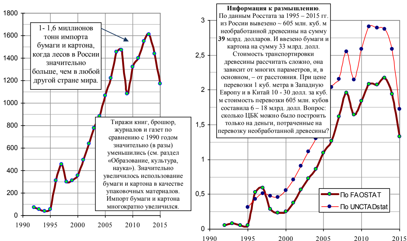
Рис. 1.179, а. Импорт РФ бумаги и картона, тыс. т.