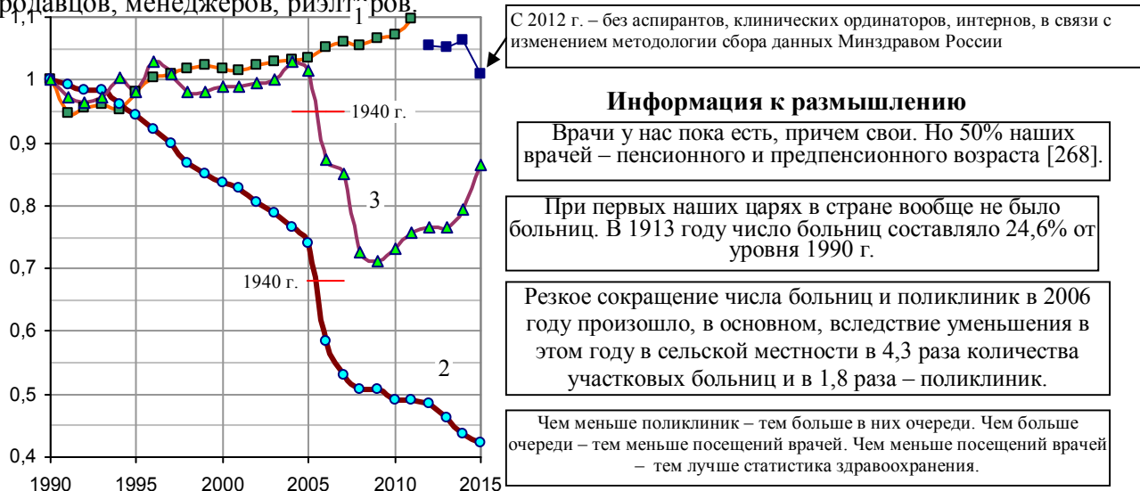
Рис. 3.4, а. Изменение количества врачей (1), больничных учреждений (2), врачебных амбулаторно-поликлинических учреждений (3); 1990 г. – 1, по данным на конец года.

Рост заболеваемости населения сопровождался уменьшением числа больниц и больничных коек в медучреждениях, но увеличением числа врачей (рис. 3.4, 3.5). Первое объясняется недостаточным финансированием здравоохранения, второе – сложностью изменения профессии для врачей; мало кто из них переквалифицировался во время реформ в продавцов, менеджеров, риэлторов.