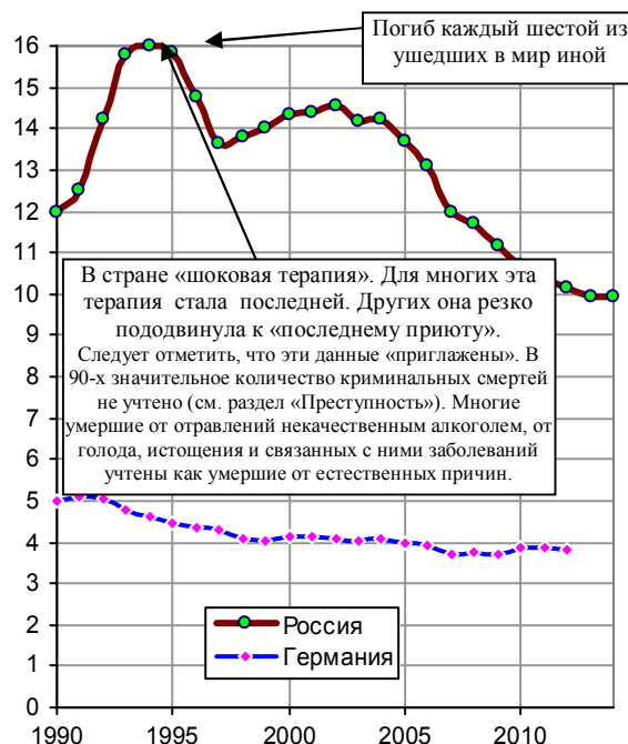
Рис. 2.30. Смертность от внешних причин в процентах от общей смертности. Источник: Росстат [I.6].