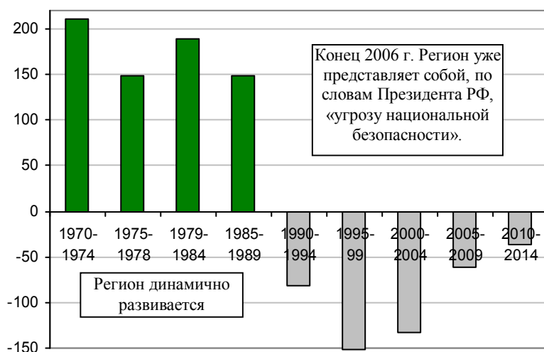
Рис. 2.6, б. Ежедневное (в среднем за указанный период) изменение количества жителей в Приморском и Хабаровском краях и Амурской области, человек. Рассчитано по данным Росстата.