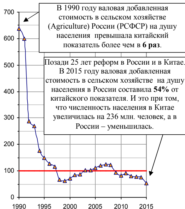
Рис. 1.327. Валовая добавленная стоимость в сельском хозяйстве на душу населения в России в процентах от этого показателя в Китае. При расчете использованы данные World Data Bank, WDI.

Изменение ВДС в постоянных ценах позволяет: