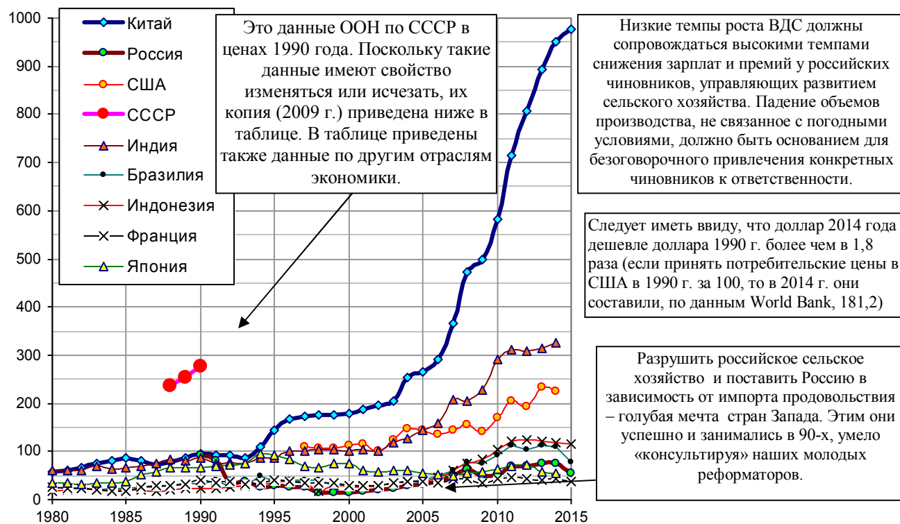
Рис. 1.325. Валовая добавленная стоимость в сельском хозяйстве (Agriculture, value added), млрд. долл., в текущих ценах.

Валовая добавленная стоимость (ВДС) характеризует мощь сельского хозяйства государства. Ее величина, приходящаяся на душу населения, определяет уровень самообеспеченности государства продовольствием, а величина на одного работающего – эффективность работы в сельском хозяйстве. Для возможности сопоставления величин НДС в сельском хозяйстве крупных стран в каждом конкретном году на рис. 1.325 – 1.327 они представлены в текущих ценах. Неудовлетворительные показатели в сельском хозяйстве РФ в 1990-х – следствие некомпетентности руководства страны.