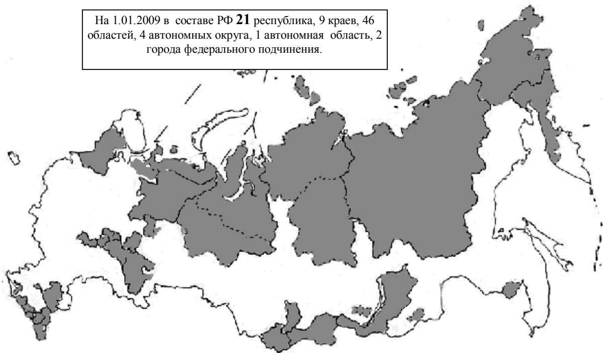
Рис. 8.1. Контурная карта Российской Федерации. Темным цветом показаны республики и автономные округа, входящие в состав Российской Федерации (по состоянию на 2000 год).

На 1.01.2009 в составе РФ 21 республика, 9 краев, 46 областей, 4 автономных округа, 1 автономная область, 2 города федерального подчинения.